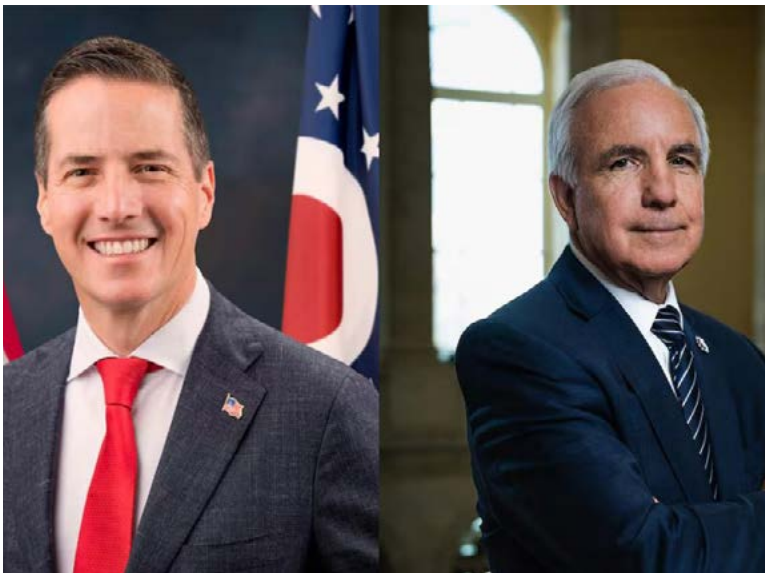
Los congresistas Bernie Moreno y Carlos Giménez, convertidos en ejecutores de la agenda de la ultraderecha colombiana, han reducido su labor en Washington a simples «mandaderos» de una oposición desesperada por la descertificación de su propio país. Su gestión, lejos de influir en la Casa Blanca, ha quedado relegada a coordinar sesiones fotográficas para una dirigencia que busca en el extranjero la legitimidad que no encuentra en las urnas.

Colombia y la imposición de aranceles, una jugada que golpearía el bolsillo de todos los ciudadanos con tal de asfixiar políticamente al Gobierno.