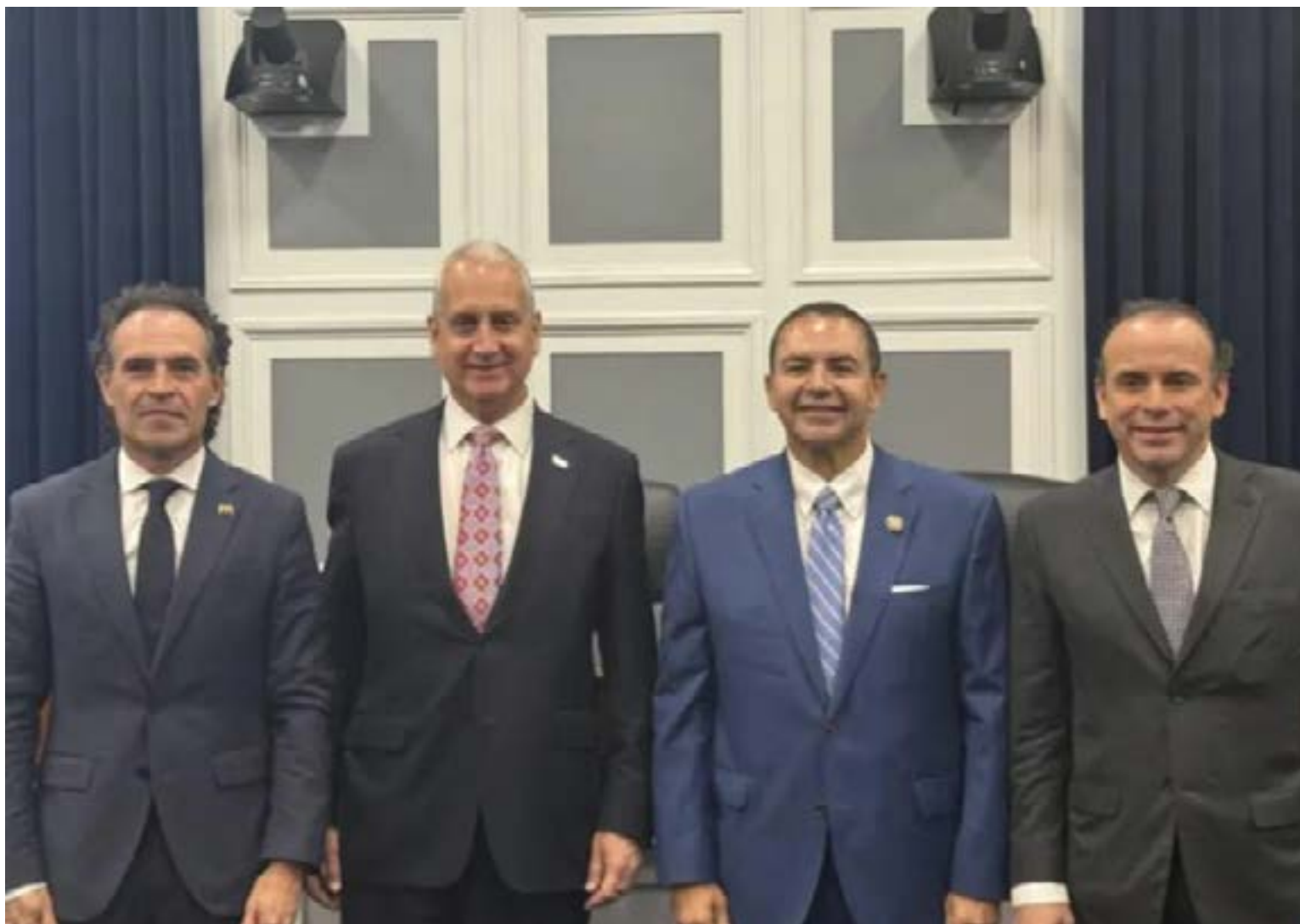
Los alcaldes de Medellín y Cali también acudieron ante congresistas de la ultraderecha estadounidense para acusar a Petro, solicitar la descertificación de Colombia y clamar por una intervención que derroque al mandatario. Tras ser ignorados por los canales diplomáticos oficiales, los mandatarios locales debieron conformarse con capturar imágenes en sedes gubernamentales para simular un respaldo político que Washington, en la práctica, les negó.