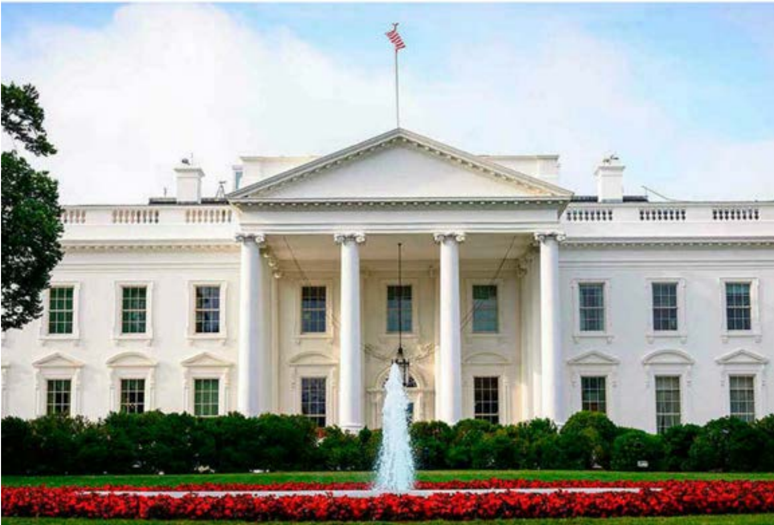
La Casa Blanca será el sitio de encuentro entre los presidentes de Colombia, Gustavo Petro y de Estados Unidos, Donald Trump.

E l engranaje diplomático entre la Casa de Nariño y la Casa Blanca ha ingresado en su fase de máxima gravitación. La canciller colombiana, Rosa Yolanda Villavicencio Mapy, y el secretario de Estado de los Estados Unidos, Marco Rubio, consolidaron un diálogo estratégico destinado a blindar los pormenores de la cumbre bilateral entre los presidentes Gustavo Petro y Donald Trump, programada para el próximo 3 de febrero.