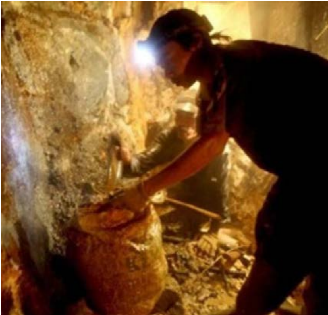
Las zonas más ricas y disputadas por el oro en Antioquia son el Bajo Cauca (municipios como Cáceres, Caucasia, El Bagre, y Tarazá) y el Nordeste Antioqueño (Remedios y Segovia), donde la minería, legal e ilegal, es la principal actividad económica.

Las ganancias multimillonarias obtenidas del oro ilícito son reinvertidas en la expansión de las