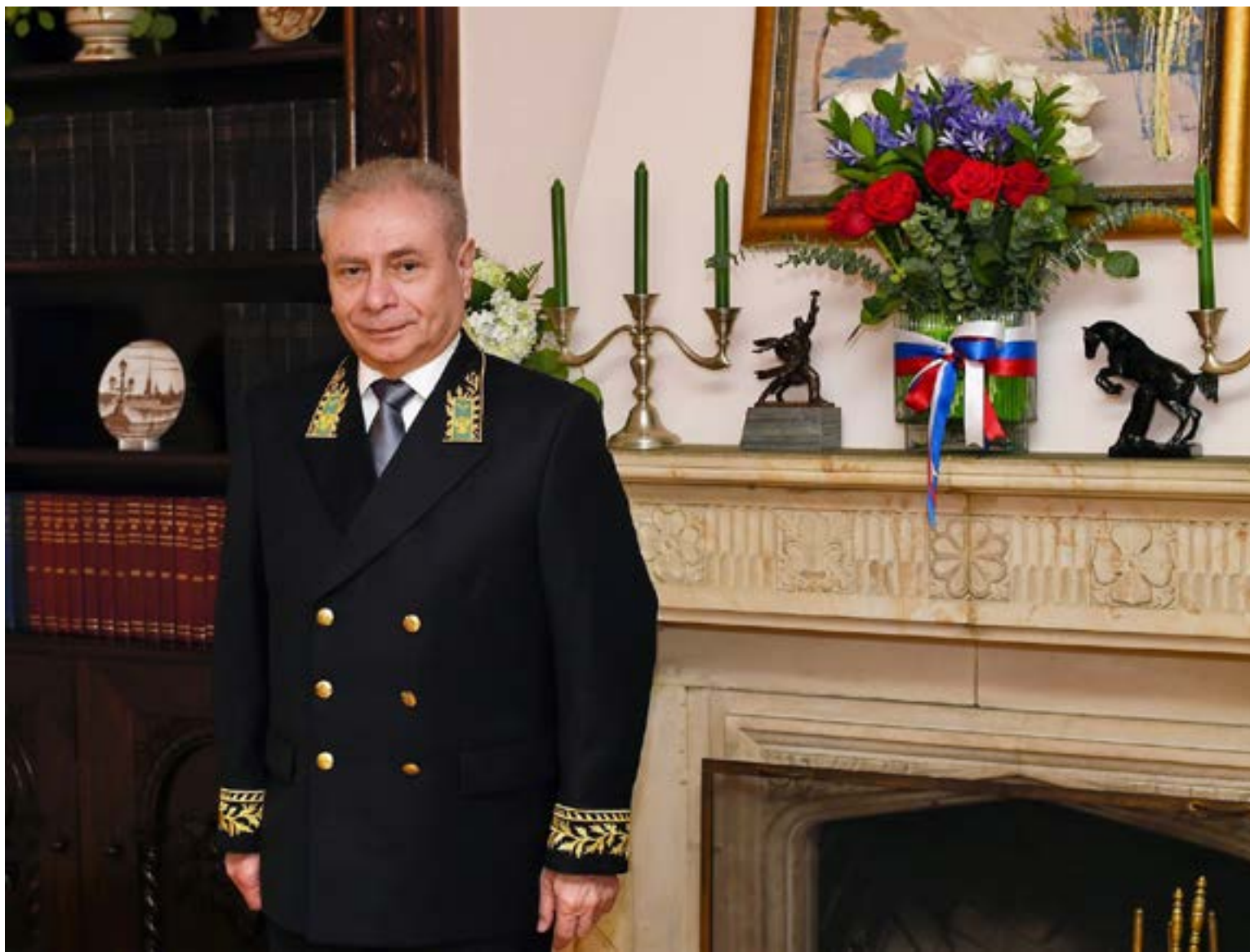
«Para Colombia, Rusia es un amigo y socio fiable»

visitaron Colombia para filmar sus reportajes y mostrar a los espectadores rusos este país tan lejano e interesante. Muchos colombianos también tienen ganas de visitar a nuestro país. Con este fin ayudamos a que se establezcan lazos de cooperación entre agencias de turismo de los dos países, lo que ayudaría a aprovechar el potencial que tenemos en este ámbito.