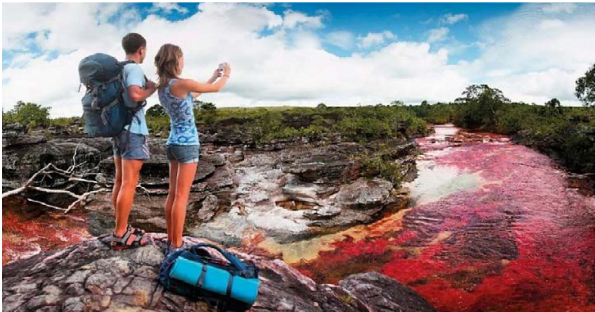
Colombia «el País de la Belleza».